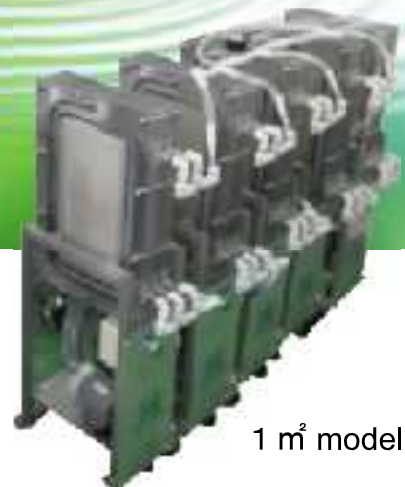
1 m 2 model