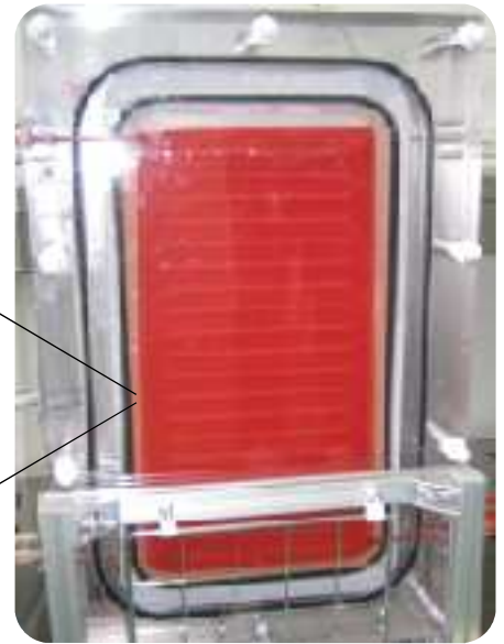
孔拡散膜（特許取得済）