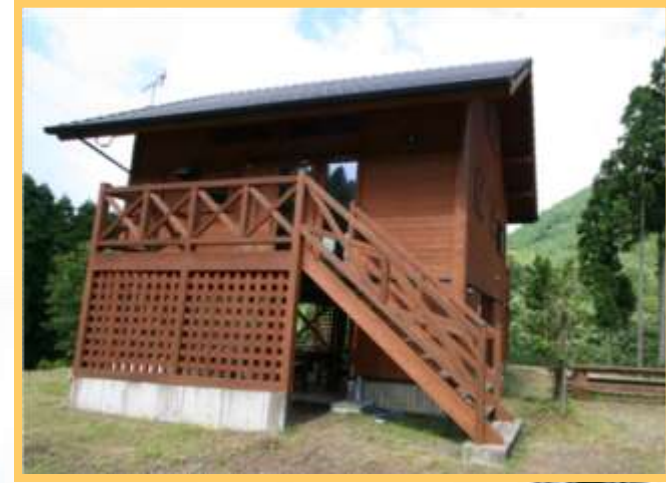
木造建築宿泊体験場(もやいの森)

ウッディ工房では、ログハウスの住みやすさ、木のぬくもりを肌で感じていただけるように、お客様にログハウスまたは木造建築での 宿泊体験 を行っています。 地元の山菜をふんだんに使ったスーパー七輪でのバーベキューや温泉などで一日を過ごしていただき、ライフワークのシミュレーションをしていただきます。