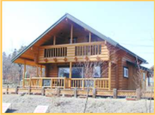
ログハウス宿泊体験場(ウッズステージ)

ウッディ工房では、ログハウスの住みやすさ、木のぬくもりを肌で感じていただけるように、お客様にログハウスまたは木造建築での 宿泊体験 を行っています。 地元の山菜をふんだんに使ったスーパー七輪でのバーベキューや温泉などで一日を過ごしていただき、ライフワークのシミュレーションをしていただきます。